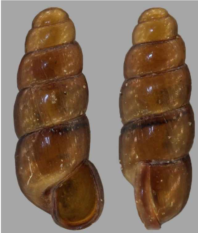
FIG. 1. — L'Aiguillette luisante Platyla polita (W. Hartmann, 1840).