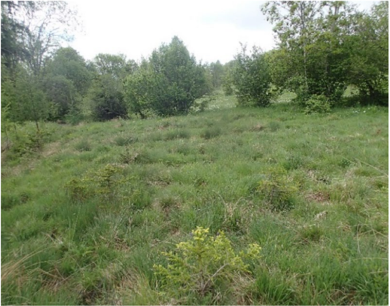
FIG. 2. — Habitat à Aiguillette luisante, Platyla polita (W. Hartmann, 1840) sur le site de « La Bise ».

Platyla polita a été découverte dans une prairie humide à Molinie (Fig. 2), le 23 mai 2018 (obs. Marin Marmier & Cédric Roy) (X(L93) = 943700, Y(L93) = 6394920 – X(WGS84) = 6,0720954, Y(WGS84) = 44,6106998). Lors de cette journée de prospection, sept prélèvements ont été réalisés sur le secteur dans des prairies humides. Seulement un s'est révélé être positif et cinq individus ont été trouvés dans cet échantillon. L'espèce n'a pas été trouvée vivante sur le site mais les coquilles prélevées étaient fraîches (Fig. 1).