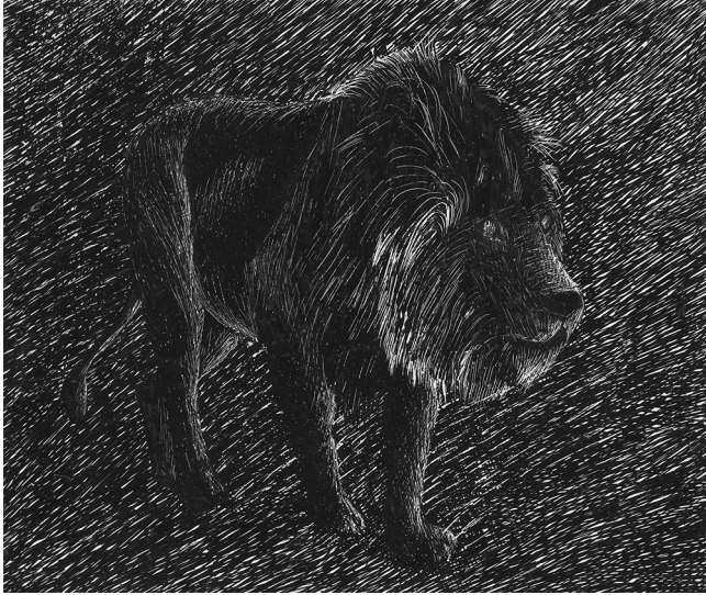
FIG. 2. — Dessin d'un lion ( Panthera leo (Linnaeus, 1758)) par Jean-Claude Rage (probablement années 1980)./Drawing of a lion ( Panthera leo (Linnaeus, 1758)) by Jean-Claude Rage (probably from the 1980s).

suggèrent un certain potentiel de mouvement dans la mandibule entre les os dentaires et post-dentaires, conformément aux idées sur l'évolution d'une charnière intramandibulaire chez les Varanidae Gray, 1827, Heloderma Wiegmann, 1829, les serpents et les mosasauridés. Les auteurs transfèrent l'espèce feisti au nouveau genre Paranecrosaurus Smith & Habersetzer, 2021 et l'attribuent à la famille des Palaeo- varanidae Georgalis, 2017. L'analyse du contenu stomacal (qui révèle le deuxième spécimen connu du squamate Cryptolacerta hassiaca Müller, Hipsley, Head, Kardjilov, Hilger, Wuttke & Reisz, 2011), combinée avec l'analyse morphologique, reconstruit P. feisti (Stritzke, 1983) comme un puissant squamate varanoïde faunivore-carnivore avec un museau sensitif. Leur étude suggère que, si la phylogénie moléculaire des anguimorphes est correcte, de nombreuses caractéristiques partagées par les Helodermatidae Gray, 1837 et les Varanidae seraient apparues de manière convergente, partiellement en lien avec l'alimentation.