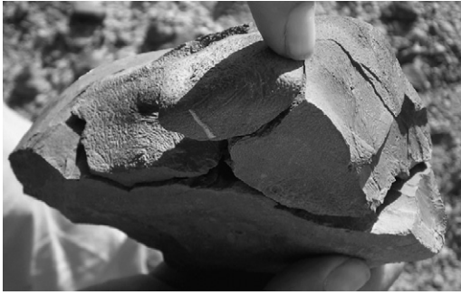
Fig. 5. Remontages à Chekheyti Issie 3.