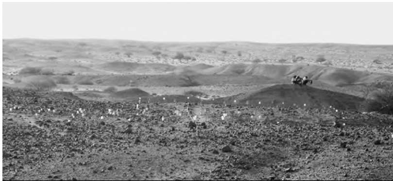
Fig. 3. Vue générale du site de Chekheyti Issie 3. La collecte de surface par mètre carré est indiquée par les drapeaux.

Fig. 3. General view of the site of Chekheyti Issie 3. Collection squares (1 m) marked by flags.