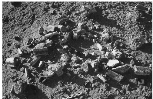
Fig. 4. Restes fossilisés d'hippopotame à Chekheyti Issie 3.

that dissect the site (Fig. 3). The surface materials in this area, the richest portion of the site, were systematically collected across 111 m 2 because of the high risk of loss via erosion during the next rainy season. Surface collection was performed by the square meter, according to the organization of a traditional archaeological grid. Each one-meter square was digitally photographed, and the photo printed immediately in the field. Each faunal remain and lithic piece collected was then identified on the photograph and labelled accordingly. Thus, we are able to reconstruct the spatial distribution of the