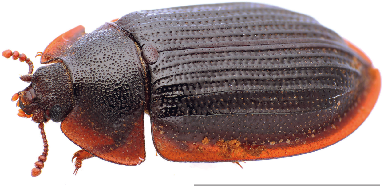
FIG. 1. — Habitus de Peltis ferruginea (Linnaeus, 1758), vue de côté. Échelle : 0,5 mm.