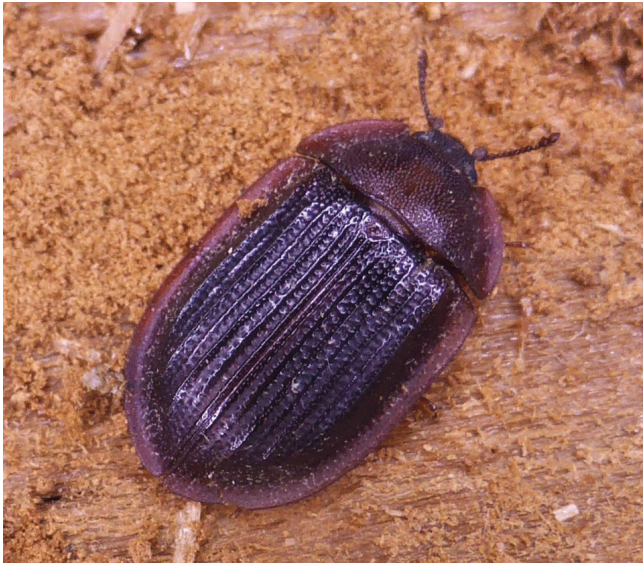
FIG. 3. — Peltis ferruginea (Linnaeus, 1758) in natura , Bessède-de-Sault (France, département de l'Aude), 15 novembre 2017.