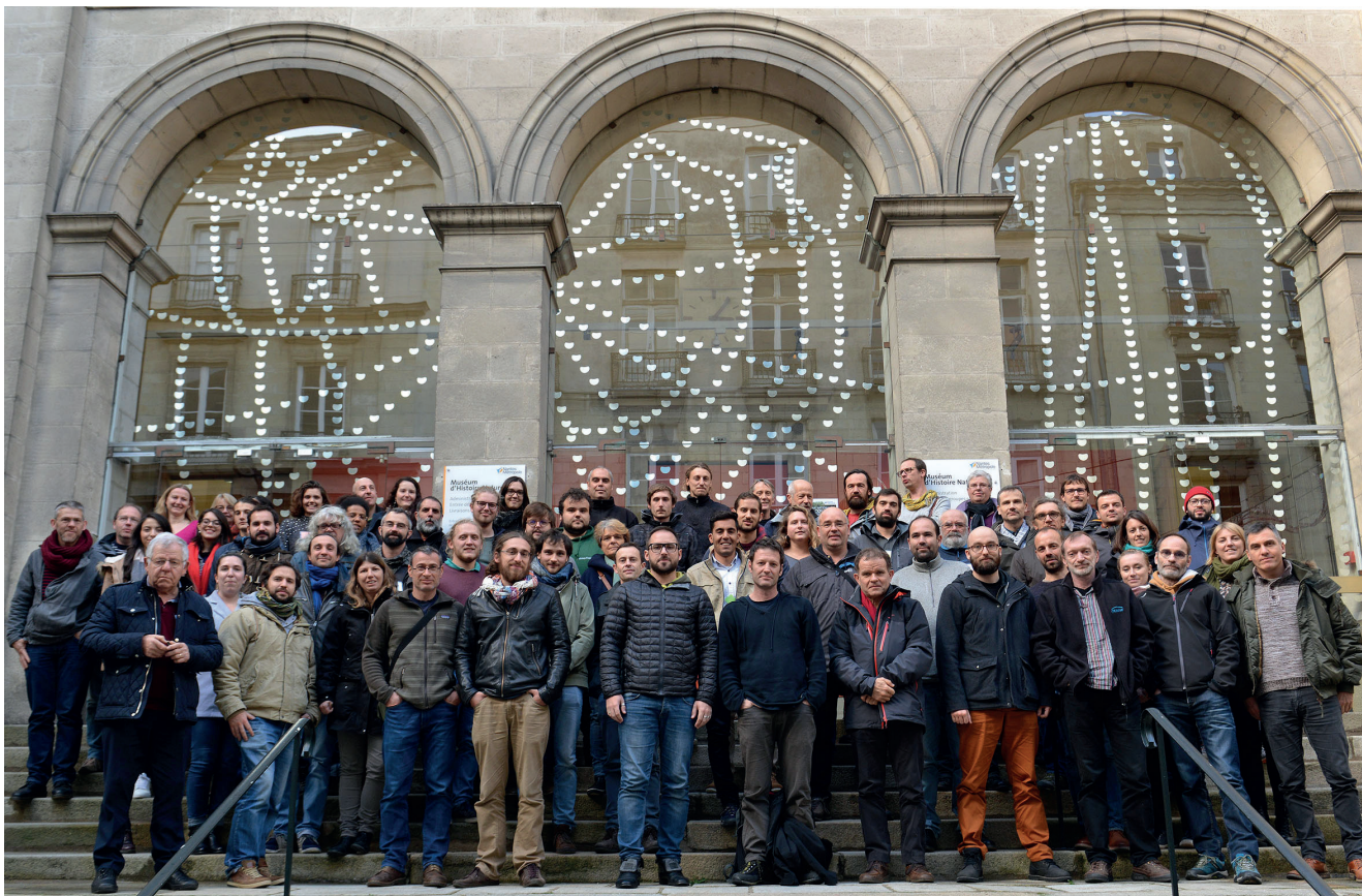
FIG. 2. — Participants du colloque national de malacologie – Nantes 2018.

cette liste stimulera la poursuite de la dynamique lancée en 2016 et que de nouveaux projets naissent parmi les malacologues de France.