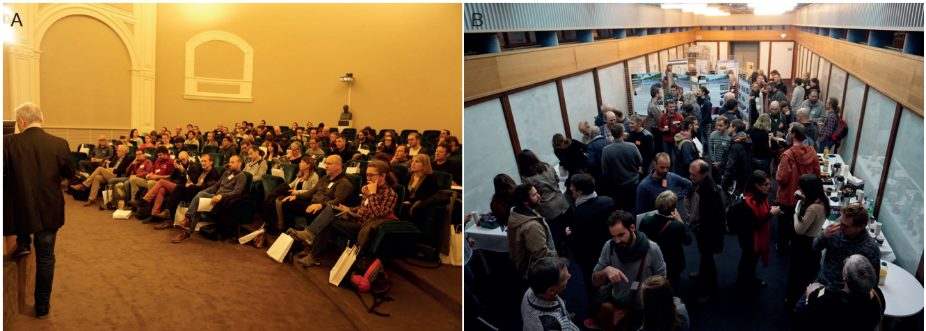
Fig. 1. — Salle de conférence du Muséum d'Histoire naturelle de Nantes (A) et espace de convivialité et des sessions posters (B).