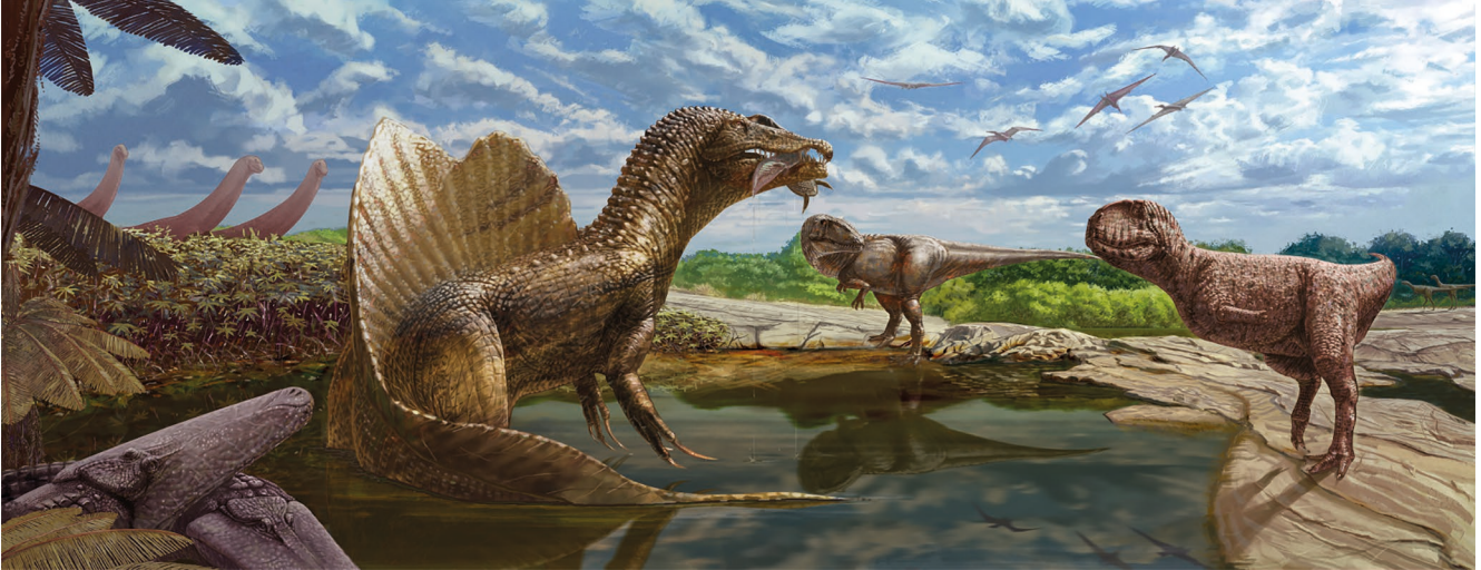
Fig. 2. — Reconstruction du paléocosystème de la Formation de Bahariya du Crétacé supérieur (Cénomani) de l'oasis de Bahariya (Égypte). Au premier plan, un abélisauridé non identifié (à droite) affronte le spinosauridé Spinosaurus aegyptiacus (au centre à gauche, avec le dipneuste Retodus tuberculatus dans ses mâchoires) et le carcharodontosaure Carcharodontosaurus saharicus (au centre à droite) sous le regard de deux individus du crocodiliforme stomatosuchidé Stomatosuchus inermis (en bas à gauche). À l'arrière-plan, un troupeau du sauropode titanosaurien Paralititan stromeri (à gauche) observe la scène. En arrière-plan, deux individus du bahariasauridé Bahariasaurus ingens s'approchent (à l'extrême droite) tandis que quelques ptérosaures volent au-dessus. La végétation est dominée par la fougère arborescente Weichselia reticulata . Crédits : Œuvre d'Andrew McAfee, Musée d'histoire naturelle de Carnegie, publiée sous la licence Creative Commons Attribution 4.0 International. Image disponible à l'adresse suivante : https://commons.wikimedia.org/wiki/File:Bahariya_Formation_McAfee.jpg /Reconstruction of the palaeoecosystem of the Upper Cretaceous (Cenomanian) Bahariya Formation of the Bahariya Oasis (Egypt). In the foreground, an unidentified abelisaurid (right) confronts the spinosaurid Spinosaurus aegyptiacus (left centre, with dipnoan Retodus tuberculatus in its jaws) and the carcharodontosaurid Carcharodontosaurus saharicus (right centre) while two individuals of the stomatosuchid crocodyliform Stomatosuchus inermis (lower left corner) look on. In the background, a herd of the titanosaurian sauropod Paralititan stromeri (left) warily look on. In the background, two individuals of the bahariasaurid Bahariasaurus ingens approach (far right) while a few pterosaurs soar above. The vegetation is dominated by the tree fern Weichselia reticulata . Credits: Artwork by Andrew McAfee, Carnegie Museum of Natural History, published under the Creative Commons Attribution 4.0 International license. Image available at: https://commons.wikimedia.org/wiki/File:Bahariya_Formation_McAfee.jpg

croissait vite (p. 218) ; il atteignait sa taille adulte en pas plus de 20 ans, ce qui révèle une croissance aussi rapide que celle des éléphants africains (Horner & Padian 2004).