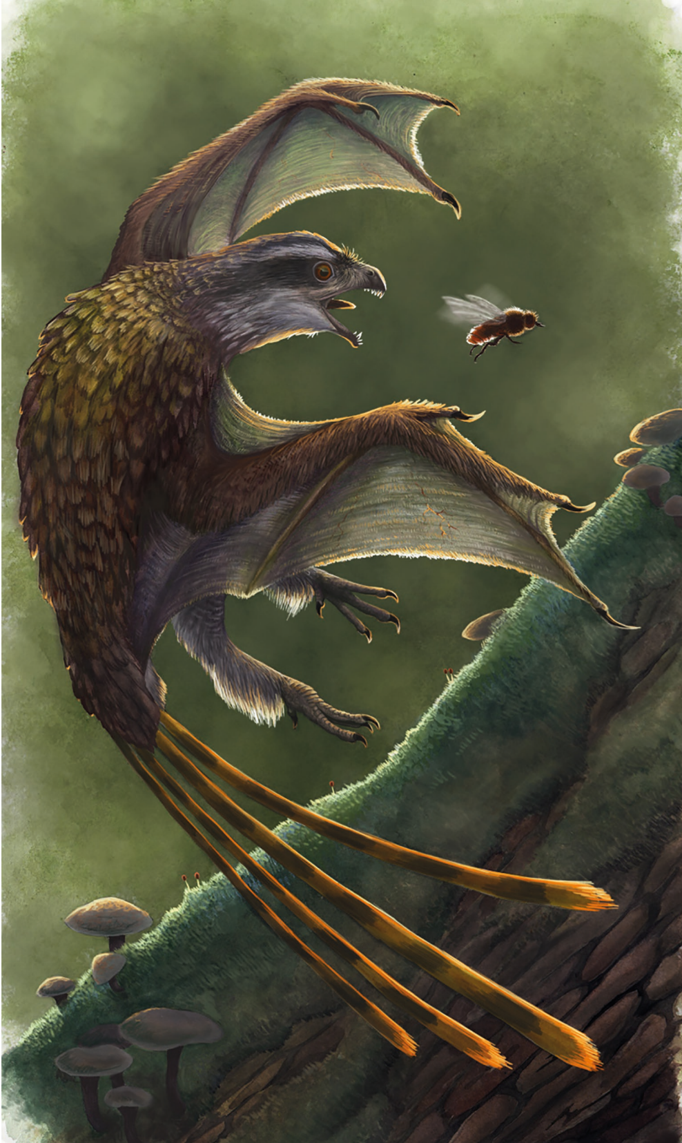
FIG. 3. — L'étrange dinosaure Yi qi, avec ses ailes membraneuses. publié sous la licence Creative Commons Attribution-Share Alike 4.0 International. Image disponible à l'adresse suivante : https://commons.wikimedia.org/w/index.php?title=File:Yi_qi_restoration.jpg&oldid=811011681 /The strange dinosaur Yi qi, with its membranous wings. published under the Creative Commons Attribution-Share Alike 4.0 International licence. Image available at: https://commons.wikimedia.org/w/index.php?title=File:Yi_qi_restoration.jpg&oldid=811011681