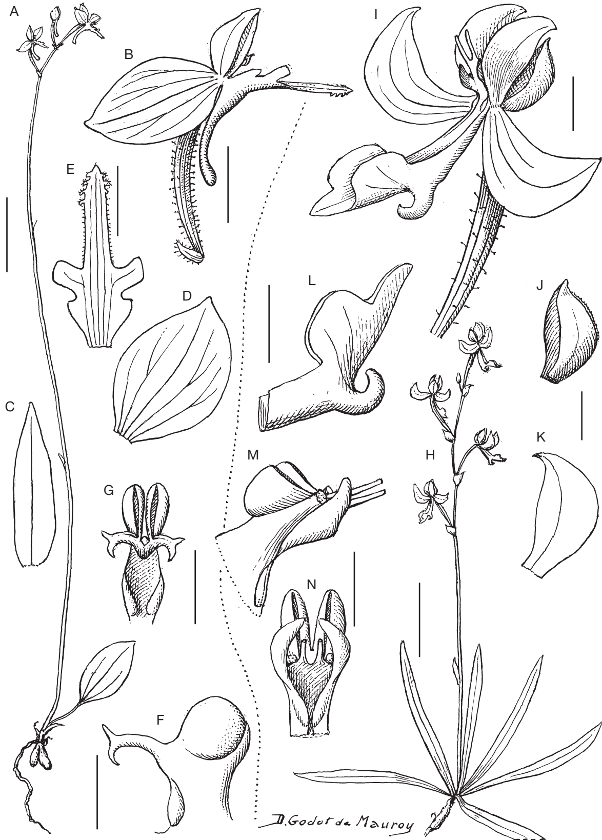
FIG. 1. — A-G, Cynorkis uliginosa Bossler, sp. nov.: A, plante fleurie ; B, fleur ; C, sépale médian ; D, pétale ; E, labelle ; F, colonne en vue latérale ; G, colonne vue de face, Humbert & Cours 23756 bis (P[P00541642]) ; H-N, Cynorkis volombato Bossler, sp. nov.: H, plante fleurie ; I, fleur ; J, sépale médian ; K, sépale latéral ; L, labelle vu de profil ; M, colonne en vue latérale ; N, colonne vue de face. Réserves Naturelles 5452 (P). Dessins : Denise Godot de Mauroy. Échelles : A, H, 2 cm ; B, 3 mm ; C-G, I-N, 2 mm.