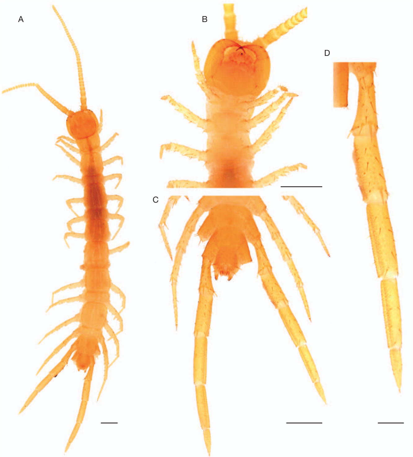
FIG. 1. — Lithobius (Lithobius) lemairei n. sp. (holotype femelle, 8 mm de long, d'Entrevaux): A , habitus, vue dorsale; B , tête et premiers segments pédifères, vue ventrale; C , derniers segments pédifères et segments gonopodiaux, vue ventrale; D , patte 14 gauche, vue ventrale. Échelles : A-C, 0,5 mm; D, 0,2 mm.

grande espèce épigée (15 à 24 mm de long) diffère fortement de L. (L.) lemairei n. sp. par de nombreux autres caractères, notamment par la présence de 12 à 16 ocelles pigmentés et par la structure de la griffe gonopodiale de la femelle qui est constamment unidentée, complètement dépourvue de dentelures latérales (Iorio 2008, 2010b).